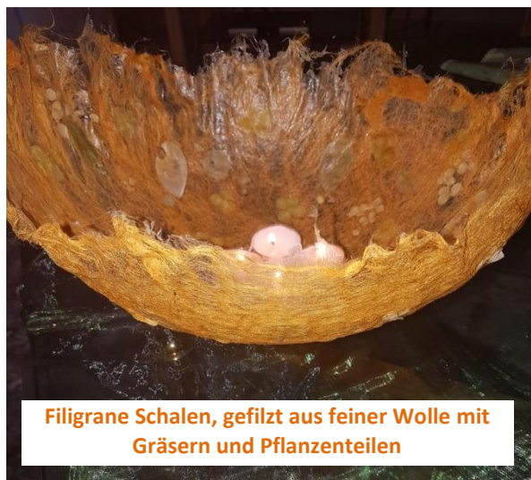
Filigrane Schalen, gefilzt aus feiner Wolle mit Gräsern und Pflanzenteilen

Das sind: Schreibwaren Meyerhofer, Bäckerei Goldjunge, Metzgerei Wehy, Optik Winkler, Christophorus- Apotheke, Frisör Rolf, Blumen-Winkler, Mory Haustechnik, Raiffeisenbank, Metzgerei Drexler Wolkersdorf und Schnapsbrennerei Scheuerpflug in Dietersdorf.